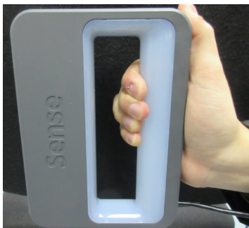
図 1 使用した 3D スキャナ

3D スキャナで取得した STL 形式のモデルデータから CL データを作成し、ロボットで良好に加工することができた。これにより、3D プリンタだけでなく加工ロボットや数値制御の工作機械でも STL 形式のデータを利用できるものと期待される。しかしながら、特徴のあるシャープなエッジ部分を再現できないという問題点があった。これは、3D スキャナで STL 形式に保存するときにエッジ部分が丸められていたため、Creo に入力した時点で実モデルの特徴が十分再現できていなかったことによると思われる。これはより高性能、高分解能の 3D スキャナを用いることで改善できるものと思われる。