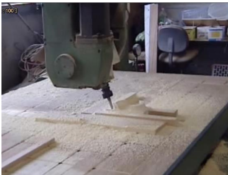
図 1 5 軸 NC 工作機械 (SOLIC Co., Ltd.)

CAM 工程にもどることなく、工具の姿勢情報を含む多軸 NC データの内容を確認できる NC ビューアを作成した。また、逆ポストを作成することで多軸 NC データから中間データである CLS データを生成させることにより、異なるタイプの NC 工作機械やロボットでも加工できるようにした。さらに、MATLAB 上で CLS データに基づく産業用ロボットの軌道シミュレーションを行うためのソフトウェアについて検討し、ロボット加工を行う場合の事前検証を可能にした。